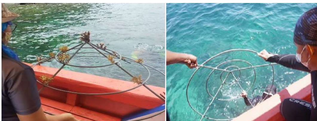
Gambar 3: Deploy media tanam ke dasar perairan, Mokotamba, Pulisan