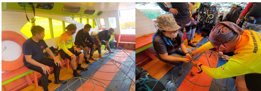
Gambar 2: Media tanam dan proses perekatan fragmen karang

Media tanam yang digunakan terbuat dari besi (ukuran 12 dan 9 meter). Dibuat dalam bentuk lingkaran menyerupai bentuk 'sondo'. Sondo adalah nama local alat untuk menyaring hasil gorengan dan makanan lainnya .